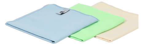
LC Silver Soft Glasklud