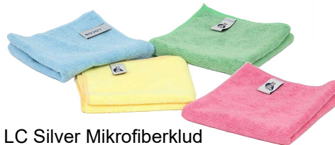
LC Silver Mikrofiberklud